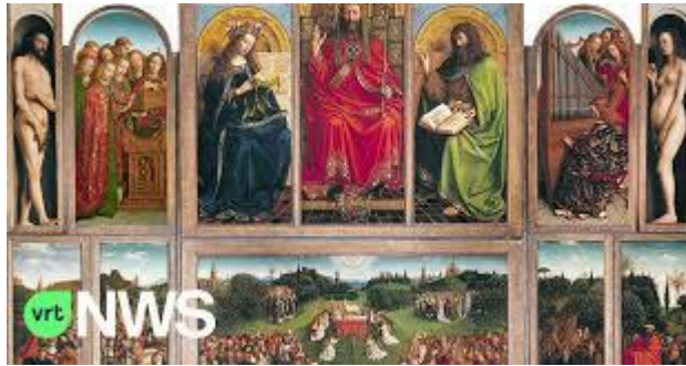
Rechtvaardige Rechters van het Lam Gods, Gent