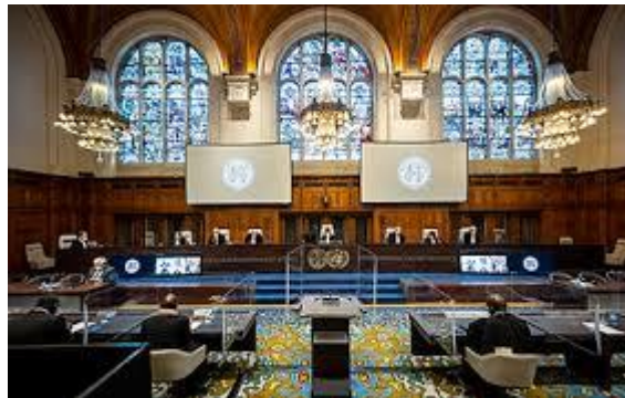
Internationaal Gerechtshof, Vredespaleis

Het recht is in essentie een systeem dat de chaos en de anarchie uitbant, waardoor zekerheid, voorspelbaarheid en vrede kunnen bestaan. Zo gezien heeft het recht slechts één doel: de orde. De rechtvaardigheid is geïmpliceerd in en de hoogste manifestatie van de orde. 37