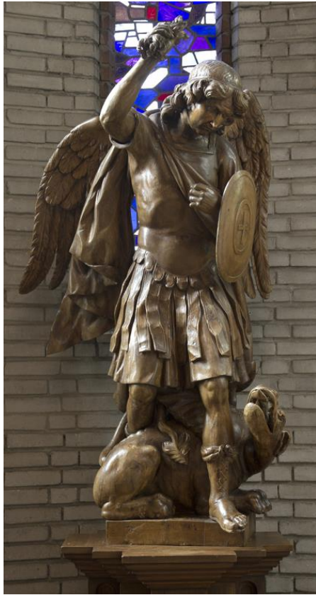
Aartsengel Michael, beschermengel van rechtvaardigheid